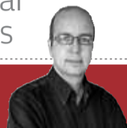
Periodista i professor de la URL